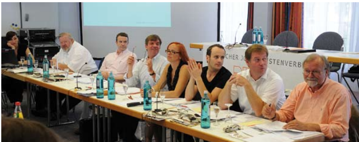
Der Vorstandstisch vor der Wiederwahl, diesmal mit einer Premiere: erstmals mit Beamer, Leinwand und Videoaufzeichnung

der Informationen. Online sei „wichtig, aber es fehlen Finanzierungsmodelle“ für eine sichere Zukunft. Der DJV-Vorsitzende warnte auch davor, die Arbeit der hauptberuflich freien Journalisten immer schlechter zu bezahlen, weil sonst am Ende nur noch ein „Piraten-Journalismus“ übrig bleibe. Geldern von Ländern oder dem Bund für Zeitungen erteilte Konken eine klare Absage, denn die Staatsferne müsse gewahrt bleiben und bei freien Medien habe der Staat „die politischen Finger rauszulassen“.