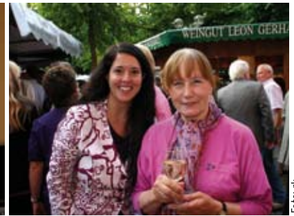
Viele frohe Gäste beim Weinfest-Treff