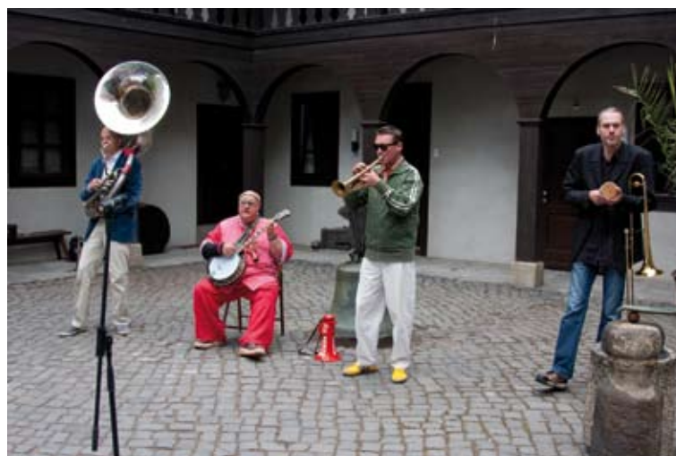
JAZZIG: Die Weimarer Band „Brass up“ traf mit allseits bekannten Rhythmen den Nerv der Gäste des Jubiläums und erhielt prompt nach dem letzten Ton viel Beifall.