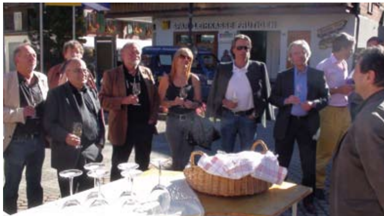
Willkommensgruß: Empfang aller Teilnehmer bei Kaiserwetter durch den Gemeindevorstand von Adelboden – mit 3500 Einwohnern und 25 000 Gästen im Jahr wichtigster Tourismusort im Berner Oberland.

Zugegeben, das Thema ist nicht neu. Es spielte bereits im Vorjahr eine Rolle, als sich diese Gruppe in Krams getroffen hatte und wirkte auch in den DJV-Verbandstag im November 2010 in Berlin hinein. Doch die Diskussion wurde gebremst, weil ein Teil von ihr Vermutungen beinhaltete. Nun aber wurde es in Bern konkret. Dafür gebührt Bittner kein Lob, aber Dank, da er viel Freizeit in Aufklärung investierte. Wie