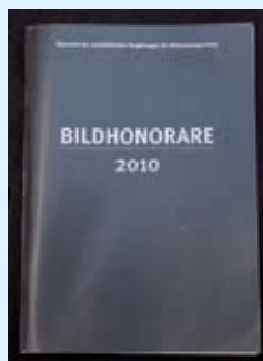
„Dieses Buch ist unser Handwerkzeug“, erklärt Hörnlein. Er braucht den schwarzen Band täglich: „Da werden jährlich die marktüblichen Bildhonorare ausgerechnet und uns mitgeteilt.“