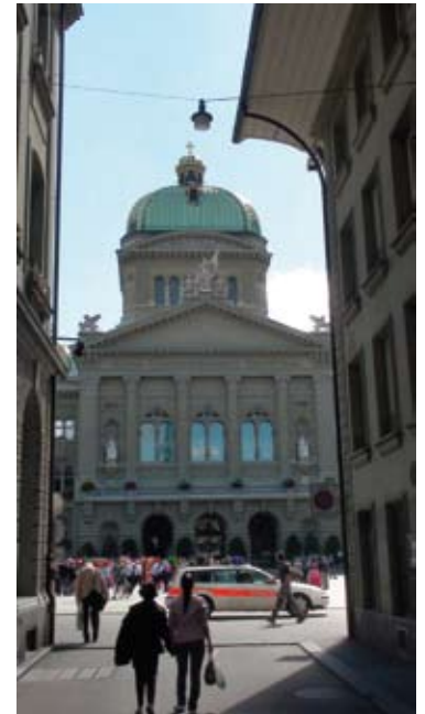
Bundeshaus Bern: Blick auf das ehrwürdige Gebäude des Schweizer Parlamentes.