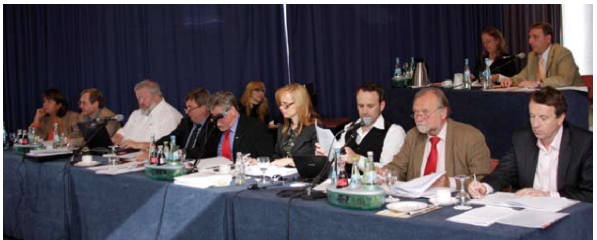
Vorstand und Tagungspräsidium beim 63. hessischen Verbandstag in Wiesbaden.

Redaktionen die Oberhand gewinnen und die Journalisten zu Handlangern degradieren. Der Gesetzgeber darf hier nicht länger zusehen. Er muss handeln und Hauptberufliche von Laien abgrenzen. Die Verleger müssen die seit 1. Februar dieses Jahres gültigen Vergütungsregeln für die freien Kolleginnen und Kollegen unverzüglich in die Tat umsetzen. Das gilt besonders auch für die hessischen Zeitungsverlage. Ich appelliere hier insbesondere nach fast 50 Jahren Abstinenz in Sachen 12A-Tarif, an die Chefredakteure, nun endlich das, was