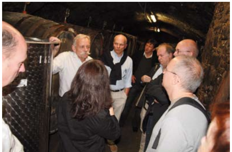
Mit großem Interesse lauschten Kollegen den Erzählungen des Winzers rund um den Wein und seine Lagerung.