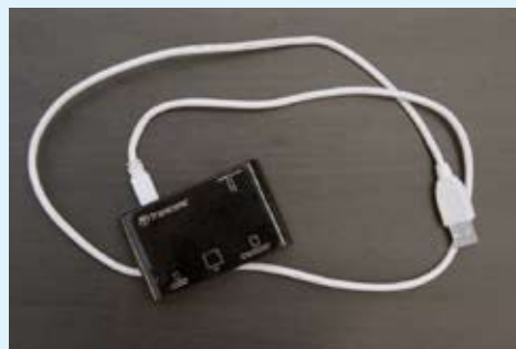
Das geheimnisvolle schwarze Kästchen ersetzt dem Fotografen die Filmdose: „Das ist ein Speicherkarten-Lesegerät für den Computer. Damit kann man die Fotos von der Speicherkarte der Digitalkamera auf dem Computer übertragen.“ Denn, so Hörnlein: „Zelluloid gibt es ja leider nicht mehr.“