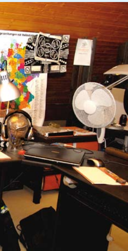
Diese Film-Klappe ist eine schöne Erinnerung an einen Auftrag für den SWR: „Ich habe für die mal Fotos gemacht und zum Dank haben sie mir diese Klappe geschenkt. Die ist bestimmt schon zehn Jahre alt.“ Hörnlein selbst filmt übrigens auch - Video-Beiträge für Online-Redaktionen.