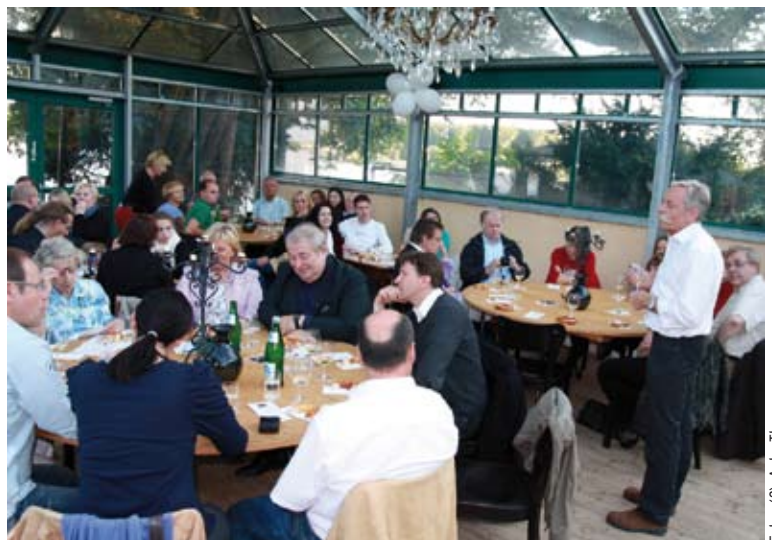
Viele frohe Mitglieder beim Sommerfest im Rheingau.