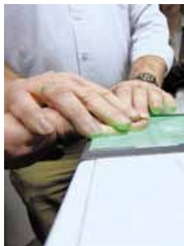
Abnahme von Fingerabdrücken mit einem neuen elektronischen Gerät.

Gerade in Südhessen tummeln sich wegen der Nähe zu den Autobahnen besonders viele zwielichtige Gestalten, wie Treusch