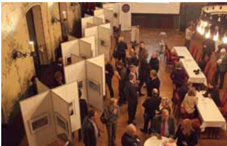
Blick von oben auf die Ausstellungsträger des Fotowettbewerbes, die mit 50 Einzelbildern und 5 Serien ab Januar 2012 unterwegs in Hessen und Thüringen sind.

Die Symbolik des doppelten L, auf Luther folgt nun Thomas Lohnes, wird spätestens beim Aufruf des Hauptpreisträgers und der Projektion seines Bildes „Fan-Tränen“ auf die Großleinwand bewusst. „Mitten wir im leben sind“, lautet ein Luther-