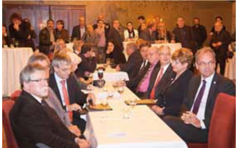
Kurzweil im Wappensaal: Im Sitzen und im Stehen verfolgten Teilnehmer des Fotowettbewerbes und Gäste die Bekanntgabe der Preisträger 2011.

rolle, sich immer wieder pointiert für soziale Belange seines Berufsstandes einsetzt, lächelte verlegen. Insgesamt sechs Mal. Dass Fromm öfter Lotto spielen möge, hat Heuser zwar nicht ernsthaft gemeint, dass Fromm ihm aber ein spezielles Foto vom Kaninchenhop, so dessen Name einer Serie, unbedingt für seine Enkelkinder zu Weihnachten schicken möge, schon.