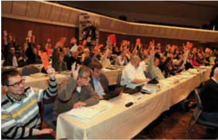
Zustimmung: Die 20 hessischen Delegierten votieren eindeutig für einen der vielen Anträge auf dem Verbandstag 2011 in Würzburg.

unternehmen geopfert werden.“ Konken dankte in dem Zusammenhang den zahlreichen Journalistinnen und Journalisten, die sich aktiv an den Tarifaueinandersetzungen mit den Verlegern für faire Tarifverträge beteiligt haben.