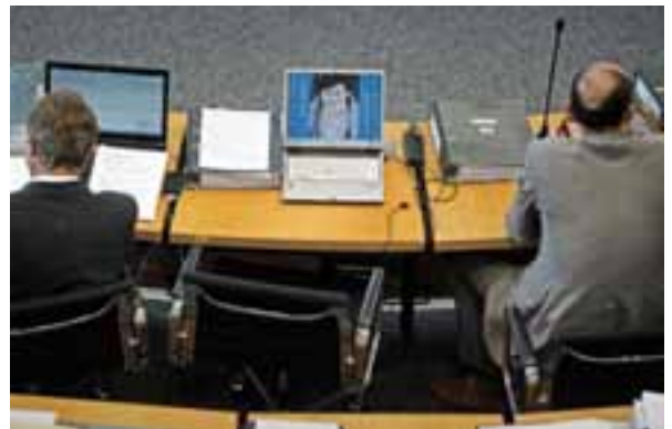
Kategorie: Sonderthema - Das Frauenbild von heute 1. Platz, Allgegenwärtig, Marco Kneise, Erfurt