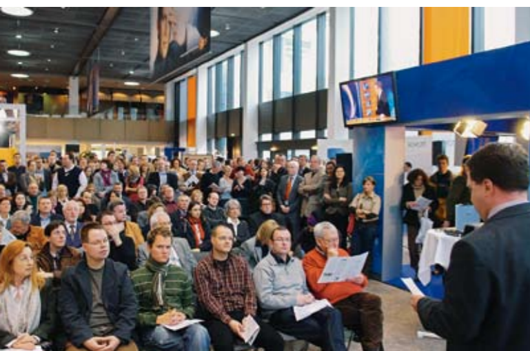
2008 war der »Süddeutsche Journalistentag« im ZDF in Mainz ein voller Erfolg.

Schon bei den Vorgänger-Veranstaltungen in Fulda, Nürnberg, Mainz und München hat das Konzept jeweils bis zu 600 Journalisten angezogen. Der »Süddeutsche Journalistentag« 2010 wird daran anknüpfen – und dabei ein Marktplatz sein, auf dem sich Unternehmen, Institutionen, Bildungsträger und Verbände präsentieren können, die Journalisten etwas zu bieten haben. Die Besucher können sich nach Belieben aus dem reichhaltigen Nutzwertangebot bedienen. Inmitten des Marktgetümmels werden drei Foren eingerichtet, in denen bekannte Hochkaräter der Branche ihren Erfahrungsschatz mit den Besucherinnen und Besuchern teilen.