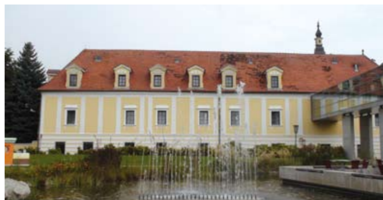
Schloss Haindorf, urkundlich erstmals 1387 erwähnt - im Kamptal in Niederösterreich