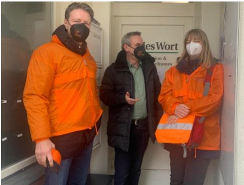
Nur zur Erinnerung: Wir kommen gern vorbei, wenn gewollt!

Deshalb sei es an dieser Stelle ausdrücklich noch einmal erwähnt: DJV-Mitglieder bekommen jederzeit kostenlose Rechtsberatung und genießen darüber hinaus auch Rechtsschutz, wenn es beispielsweise um arbeitsrechtliche oder arbeitsvertragliche Fragen geht!