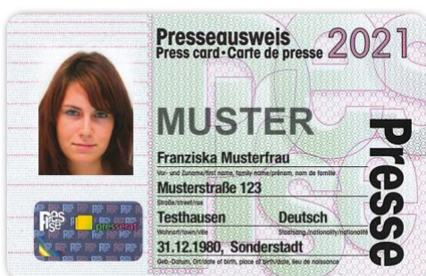
Abbildung Presseausweis 2021

Wichtig: Unabhängig davon, ob der Antrag schon jetzt eingeht oder erst in zwei Wochen - der Presseausweis 2022 wird erst ab Dezember dieses Jahres verschickt!