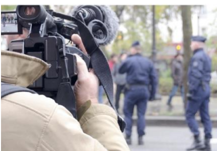
“Journalistische Berichterstattung in Einsatzlagen”